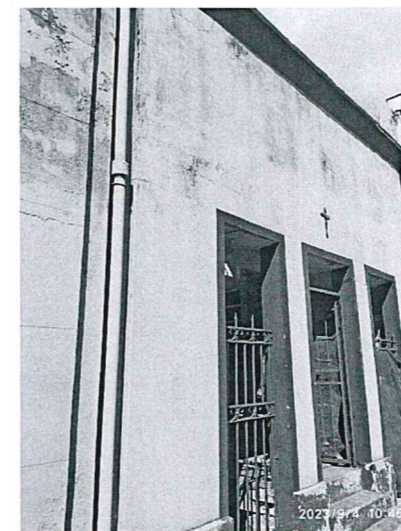
FOTO STATO DI FATTO

Le dimensioni si riferiscono all'effettivo ingombro del manufatto rilevate dall'esterno Struttura portante in muratura Solaio in voltine in mattoni forati Le facciate in scadente stato di conservazione, non presenta apprezzabili elementi architettonici